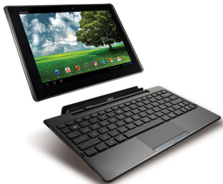
Eee Pad Transformer